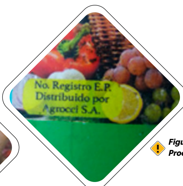
Figura 2. Etiqueta con Inscripción en Proceso o en Trámite.